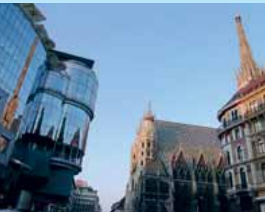
Vienne, Cathédrale St-Étienne