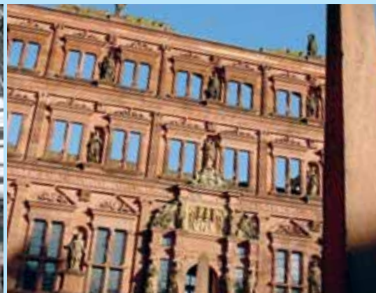
Heidelberg, le Vieux Château