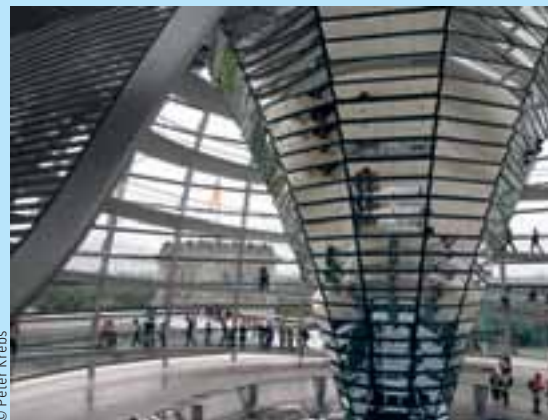
Berlin, la coupole du Reichstag