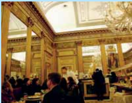
Turin, café San Carlo